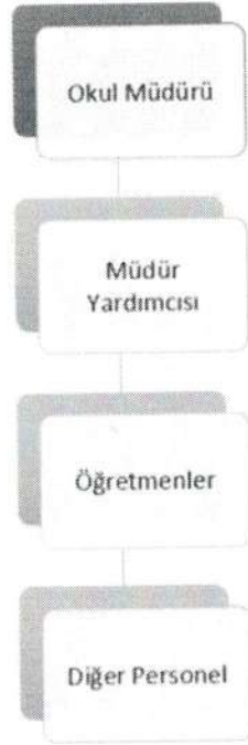
Şekil 1: Kuruluş Şeması

27.06.2019 tarih ve 30814 sayılı Resmi Gazetede yayınlanan Milli Eğitim Bakanlığına bağlı Eğitim Kurumları Yönetici ve Öğretmenlerinin norm kadrolarına ilişkin yönetmelik doğrultusunda oluşturulmuştur.